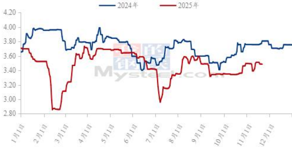
(2024年-2025年) 全国白羽肉鸡均价走势图 (元/斤)