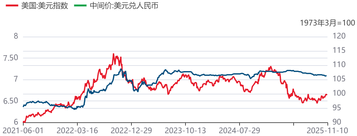
图8：人民币兑美元汇率及美元指数