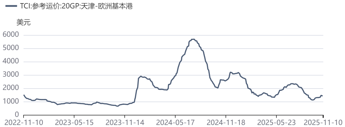
图2：TCI：天津→欧洲日度运价