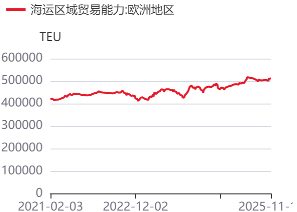
图4：亚欧航线集装箱船运力