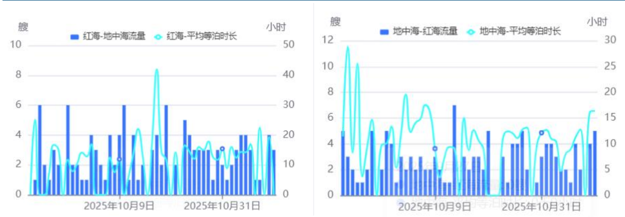
图5: 红海→地中海集装箱船舶通航量和红海平均等航时长 图6: 地中海→红海集装箱船舶通航量和地中海平均等航时长