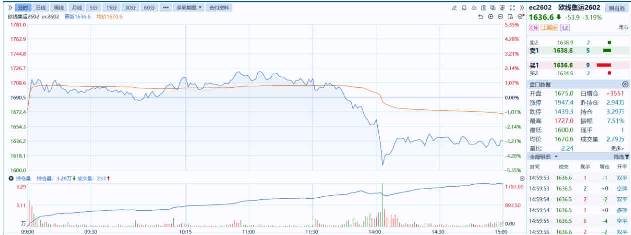
图1：主力合约日K线图