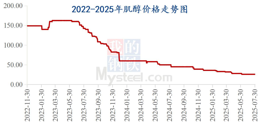
图 14 2022-2025 年肌醇价格走势

肌醇市场短期弱势难调，目前市场价格参考 25-28 元/kg，价格不断趋低至成本线附近。