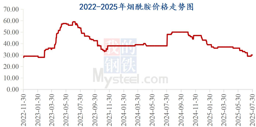
图 13 2022-2025 年烟酰胺价格走势

国内烟酰胺市场厂家提价，交投重心小幅回升，目前市场价格参考 30 元/kg 上下，价格止跌企稳运行，但需求表现仍显冷清。