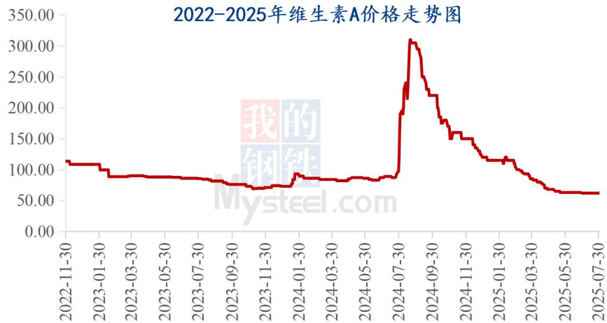
图 1 2022-2025 年维生素 A 价格走势图

维生素 A 市场整体价格盘整，目前主流报价根据品牌和保质期差异维持在 55-65 元/kg 区间，新货价格基本维持在 60-62 元/kg，国内厂家停报停签，市场观望氛围浓厚，随着场内前期低价临期货源逐渐消耗，低价回升。