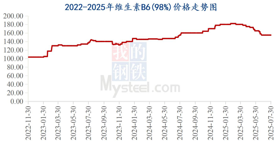
图 8 2022-2025 年维生素 B6 价格走势图

维生素 B6 市场询单相对清淡，维持刚需跟进，目前市场主流价格参考 150-155 元/kg，后市新增产能预期，个别低价下探至 145 元/公斤上下。