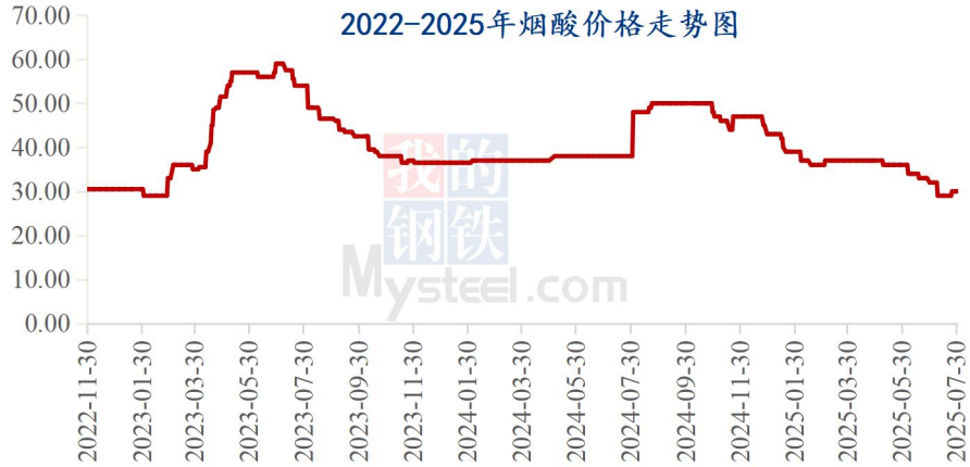
图 15 2022-2025 年烟酸价格走势图