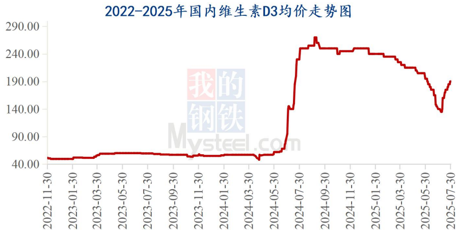
图 4 2022-2025 年维生素 D3 价格走势

维生素 D3 市场主流价格参考至 180-195 元/kg，价格上行幅度放缓，厂家方面停报停签挺价，但下游仍维持少量刚需补库，出货成交情况一般。