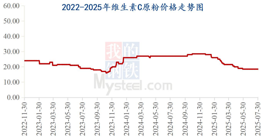
图 3 2022-2025 年维生素 C 价格走势

维生素 C 市场延续弱稳，现阶段上行动力不显，整体供大于求的局势难改，市场需求表现清淡，目前原粉市场价格暂稳运行参考 18-19 元/kg。