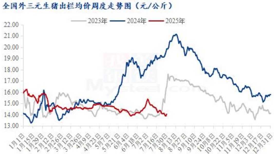
图 18 全国外三元生猪出栏均价走势图

本周全国生猪出栏均价为 14.02 元/公斤，较上周价格下跌 0.23 元/公斤，环比下跌 1.61%，同比下跌 27.51%。本周生猪价格下行，月末缩量反弹明显，周度重心下跌。供应方面来看，受外界影响，本周集团厂增量降重出猪，短期内市场供应呈现宽松态势。与此同时，社会猪源受猪价低位运行影响，养殖户普遍采取压栏惜售策略。而二次育肥群体则维持滚动出栏与补栏并行的节奏。需求方面，当前市场正处季节性消费淡季，批发市场到货量也随之下降，屠宰企业多保持低开工率，终端采购需求始终偏弱。总体而言，本周供大于求的局面加剧，虽有月底月初缩量预期，但出于降体重的要求，预计下周均价波动不明显。