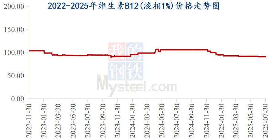
图 9 2022-2025 年维生素 B12 价格走势

本周国内维生素 B12 需求疲软，市场价格盘整运行，贸易主流报价参考 88-92 元/kg，下游终端观望为主。