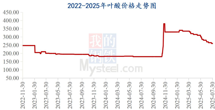
图 11 2022-2025 年叶酸价格走势

叶酸市场稳中趋弱，成交重心区间震荡为主，厂家多以高低搭货方式出货，国内叶酸市场主流报价在 250-260 元/kg 上下，市场询单成交不佳，价格弱稳调整，但高价不好成交。