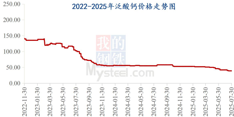
图 5 2022-2025 年泛酸钙价格走势

泛酸钙市场偏弱整理，成交重心小幅下行，目前市场主流报价在 37-40 元/公斤，高价位难以成交，部分低价成交参考 35 元/kg 上下。