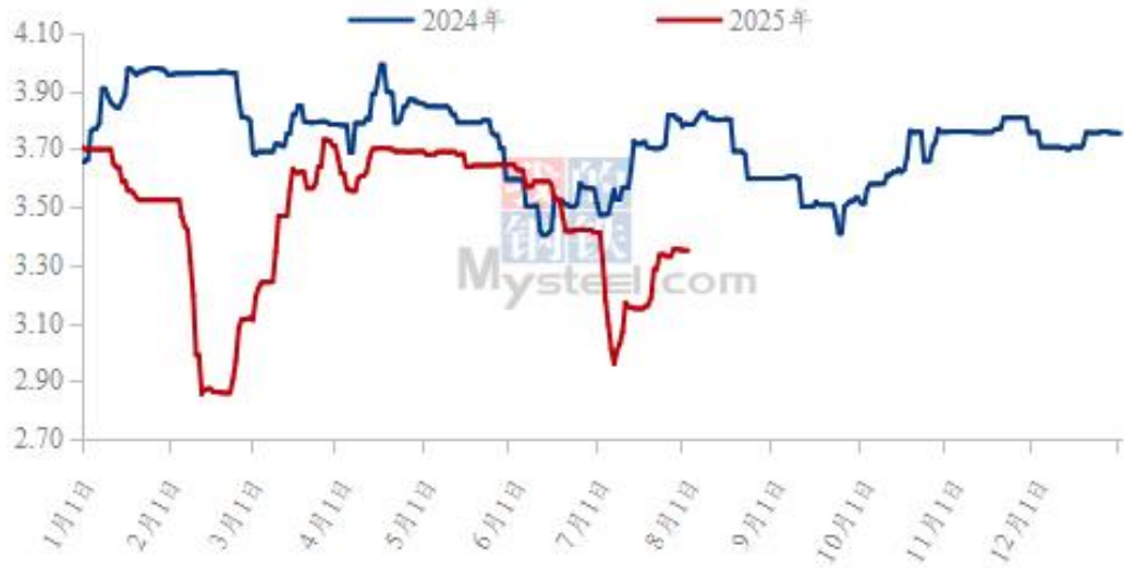
(2024年-2025年) 全国白羽肉鸡均价走势图 (元/斤)