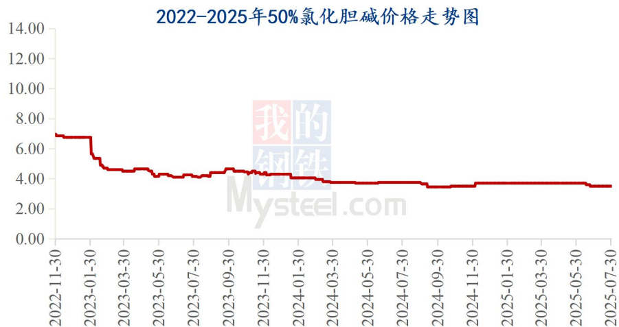
图 16 2022-2025 年氯化胆碱价格走势图

国内氯化胆碱市场近期价格弱稳运行，目前国内到厂价格参考 3.5-3.7 元/kg。