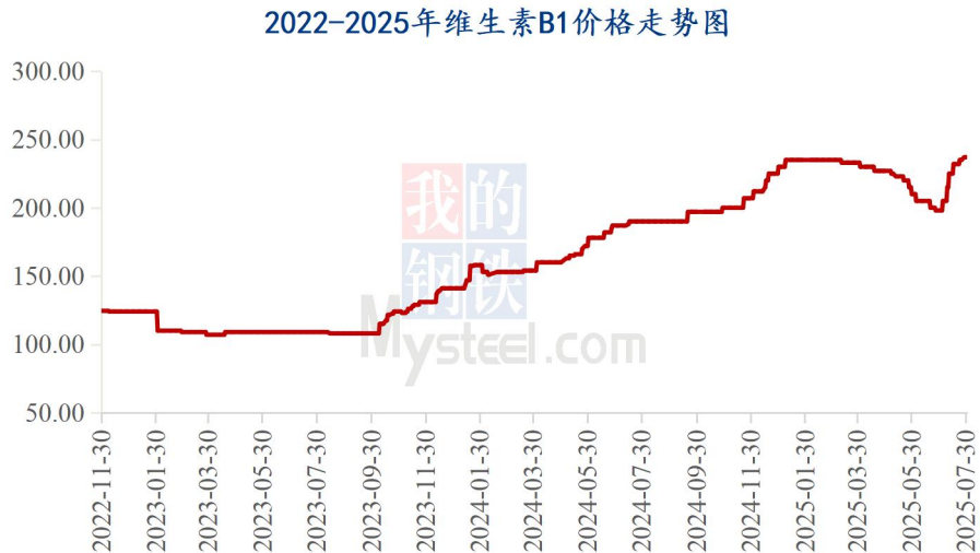
图 6 2022-2025 年维生素 B1 价格走势

维生素 B1 市场坚挺上行，国内主流大厂挺价态度明确，严控出货节奏，但采购仍显谨慎高价难以成交，主流价格运行于 235-240 元/kg 区间。