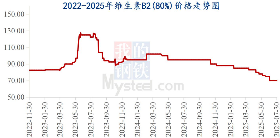
图 7 2022-2025 年维生素 B2 (80%) 价格走势图

国内维生素 B2 市场目前市场价格运行至 68-75 元/kg，行情延续弱稳，实单成交暂未有明显好转，后市有待跟进。